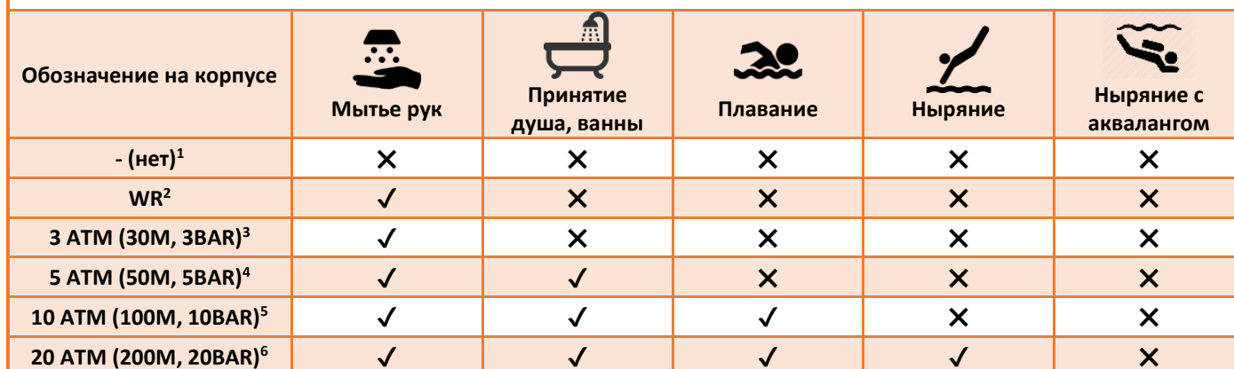
Таблица соответствий степени водозащиты

1 – Недопустим контакт с водой, брызгами, потом и т.д.