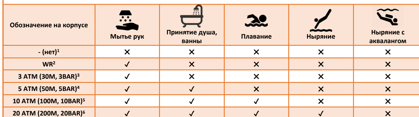
Таблица соответствий степени водозащиты

1 – Недопустим контакт с водой, брызгами, потом и т.д.