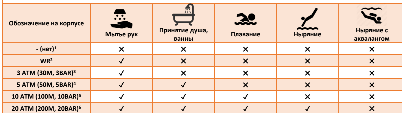
Таблица соответствий степени водозащиты

1 – Недопустим контакт с водой, брызгами, потом и т.д.